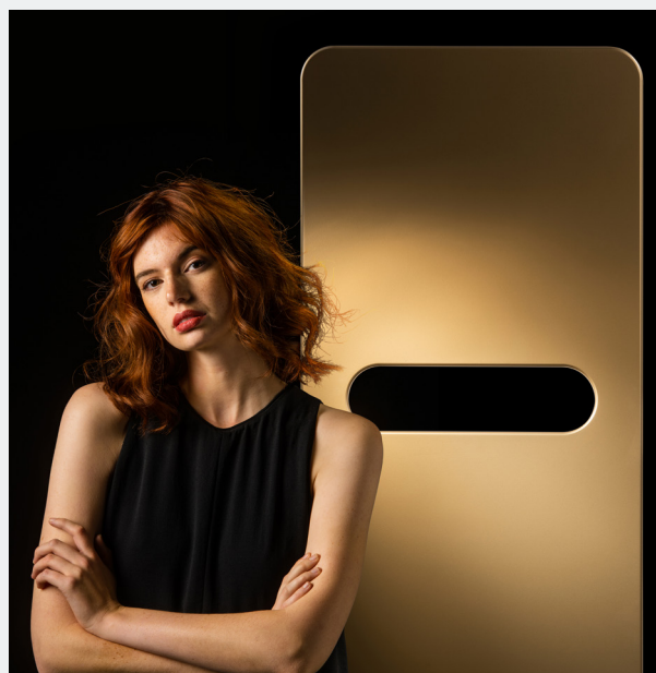
Radiateur aluminium ONI O-P, présenté ici en finition or

Dès leur parution, les catalogues et guides seront acheminés à tous les distributeurs et installateurs qui demeurent attachés - en dépit de la vague numérique -, à leur version papier.